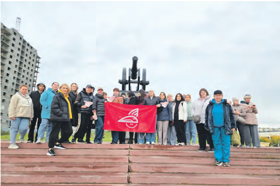
Члены профсоюза аппарата управления Южно-Уральской магистрали посетили с экскурсией город Каменск-Уральский