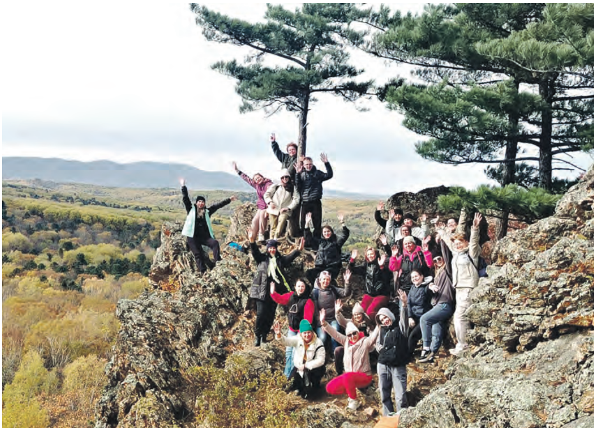
Первичная профсоюзная организация Хабаровского завода железобетонных шпал организовала для работников туристическое восхождение на горный хребет Хехцир