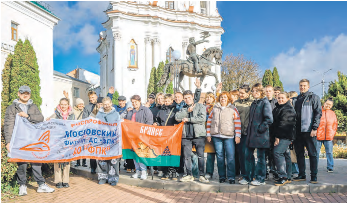
Члены профсоюза вагонного участка Брянск Московского филиала АО «ФПК» с детьми посетили город Витебск, расположенный на берегах двух рек: Западной Двины и Витьбы