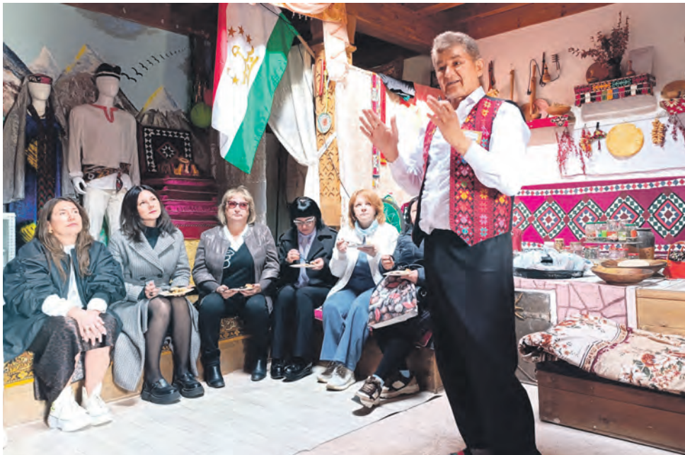
Члены профсоюзной организации Строительно-монтажного треста № 9 АО «РЖДстрой» Куйбышевской магистрали побывали в самарском Этнопарке дружбы народов