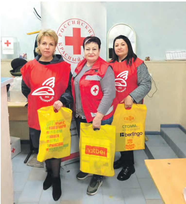
Профактив эксплуатационного локомотивного депо Старый Оскол ЮВЖД передал комплекты канцелярских принадлежностей в Старооскольское отделение Российского Красного Креста