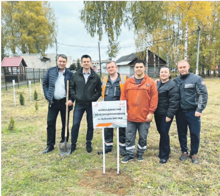
По инициативе председателей ППО эксплуатационного локомотивного депо Бабаево и одноименной дистанции пути ОЖД появилась аллея Династий железнодорожников