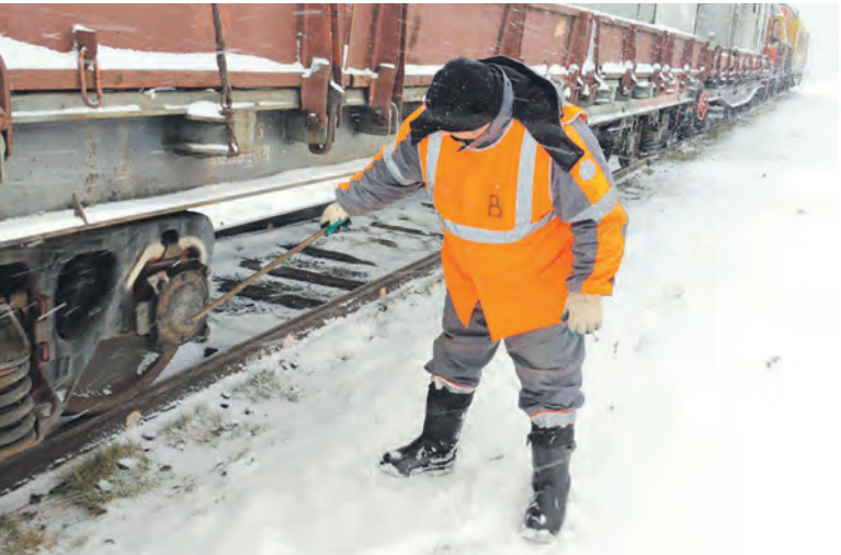
Теперь работники контрольных постов могут выйти на пенсию в 55 лет

трудоу договору или в приказе (распоряжении) работодателя, изданным с согласия работника (согласие может быть выражено в заявлении или соответствующей отметки на приказе). В соглашении определяется поручаемая сотруднику дополнительная работа, ее объем (если он может быть установлен), срок выполнения такой работы и размер доплаты за нее.