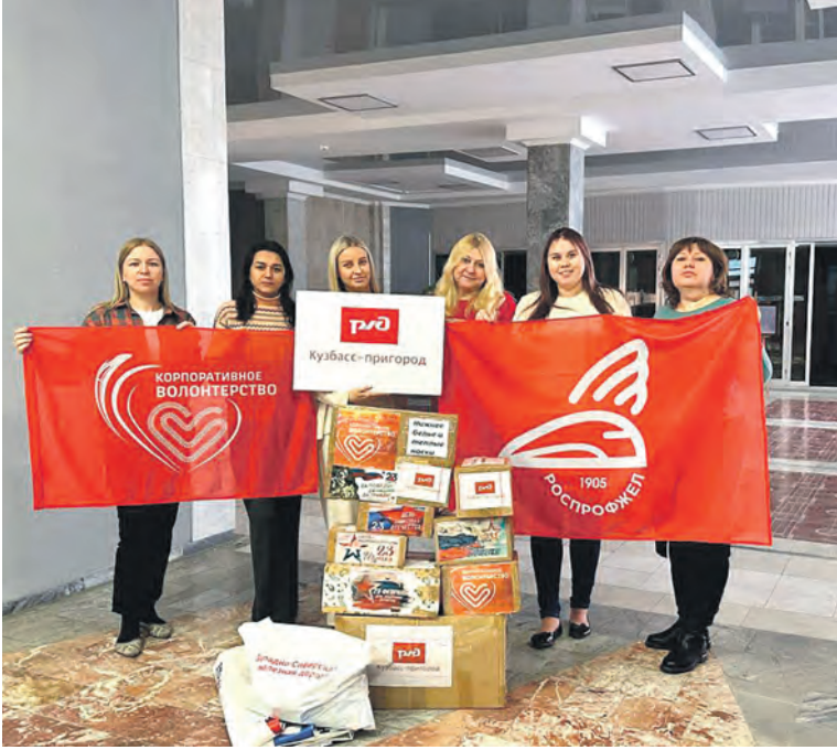
Молодежный совет Кузбасского структурного подразделения Дорпрофжел на ЗСЖД вместе с волонтерами собрал гуманитарную помощь для бойцов СВО