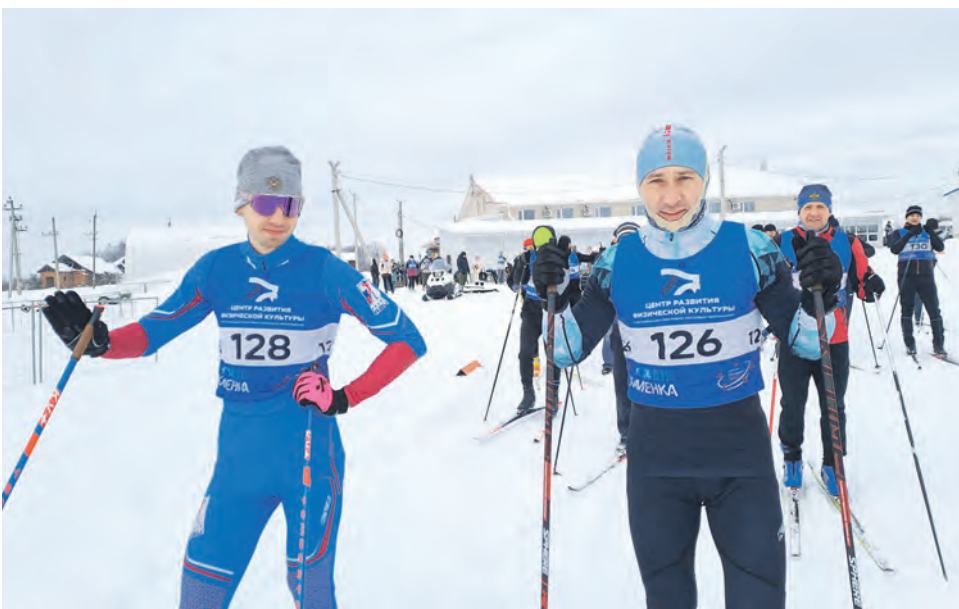
Члены профсоюза приняли участие в первенстве Смоленского региона Московской железной дороги по лыжным гонкам