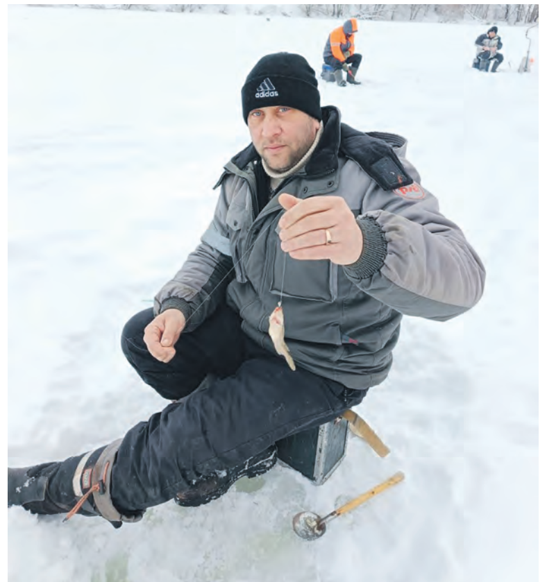
На Юго-Восточной магистрали прошло первенство эксплуатационного локомотивного депо Ртищево-Восточное по рыбной ловле «Зимний улов» среди членов профсоюза