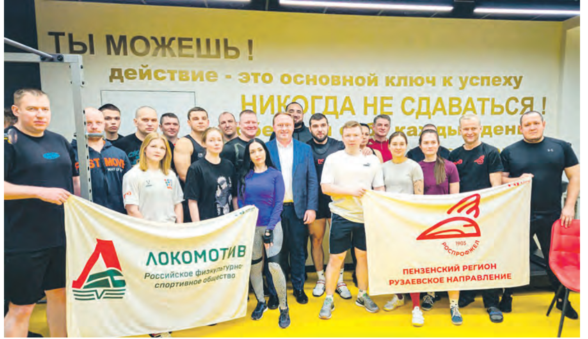
На Куйбышевской магистрали состоялось региональное первенство железнодорожников по жиму штанги лежа