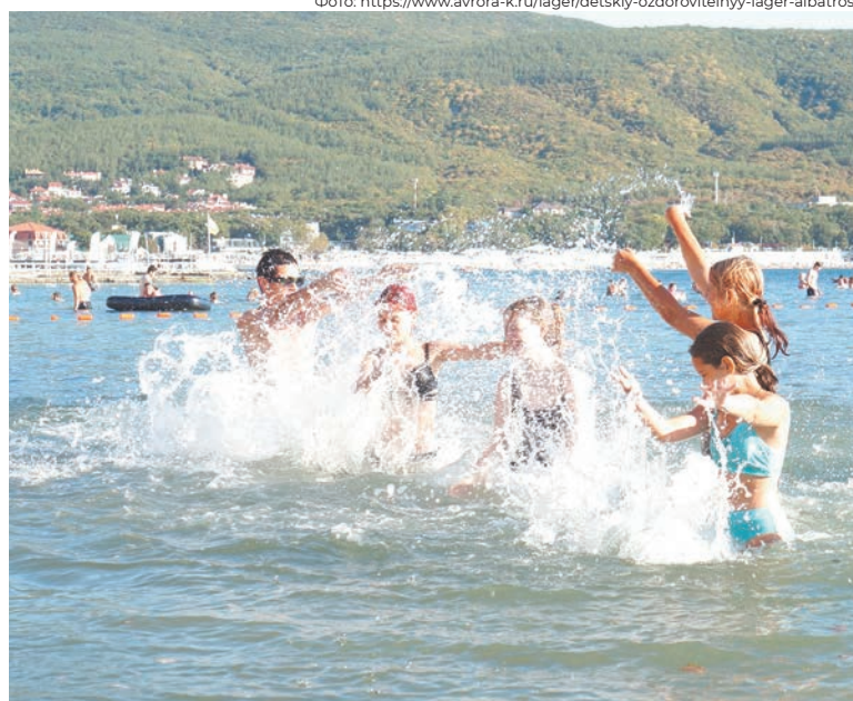
Для детей работников Московского метрополитена профсоюз совместно с работодателем для летнего оздоровительного отдыха предлагает на выбор три лагеря. Один из них «Альбатрос» на черноморском побережье