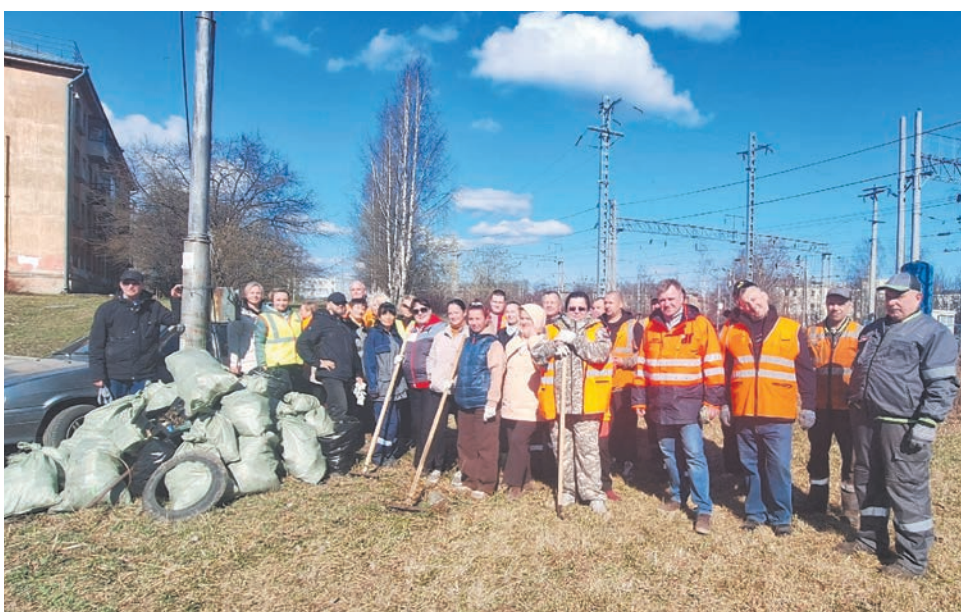
Профактив Петрозаводского региона ОЖД совместно с работниками ОАО «РЖД» и студентами Петрозаводского филиала ПГУПС благоустроили территорию у станции Петрозаводск