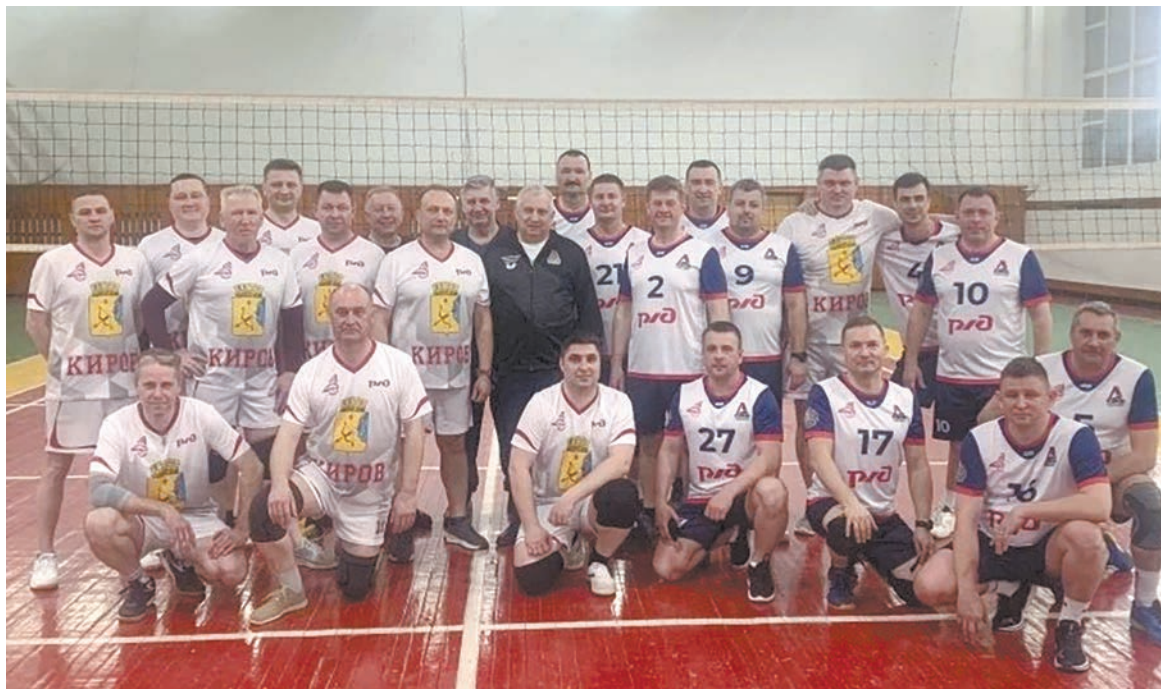
В Кировском территориальном управлении Горьковской железной дороги прошел товарищеский матч по волейболу между руководителями магистрали и представителями регионального руководства ГЖД