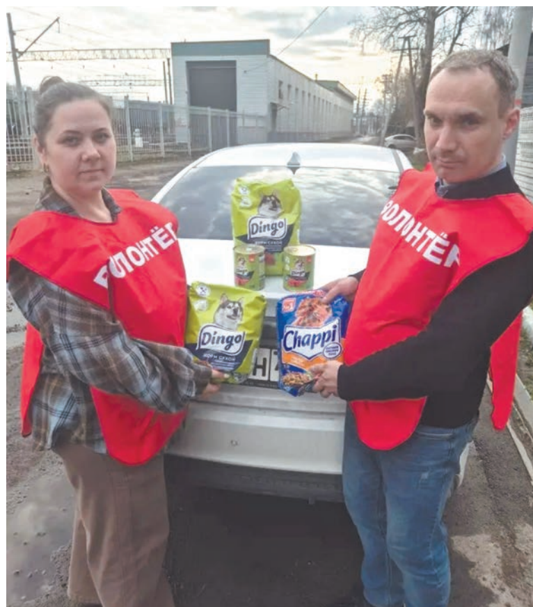
Профактивисты с Куровской дистанции пути Московской магистрали передали в фонд «Твори доброе» корм для кошек и собак