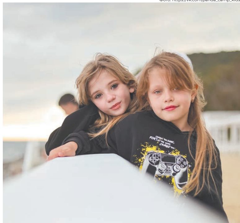
Дети работников ЦППК будущее лето проведут на море в лагере Panda camp

Все социальные льготы и гарантии, включая меры поддержки детского отдыха, закреплены в Коллективном договоре ГУП «Московский метрополитен» на 2027–2029 годы.