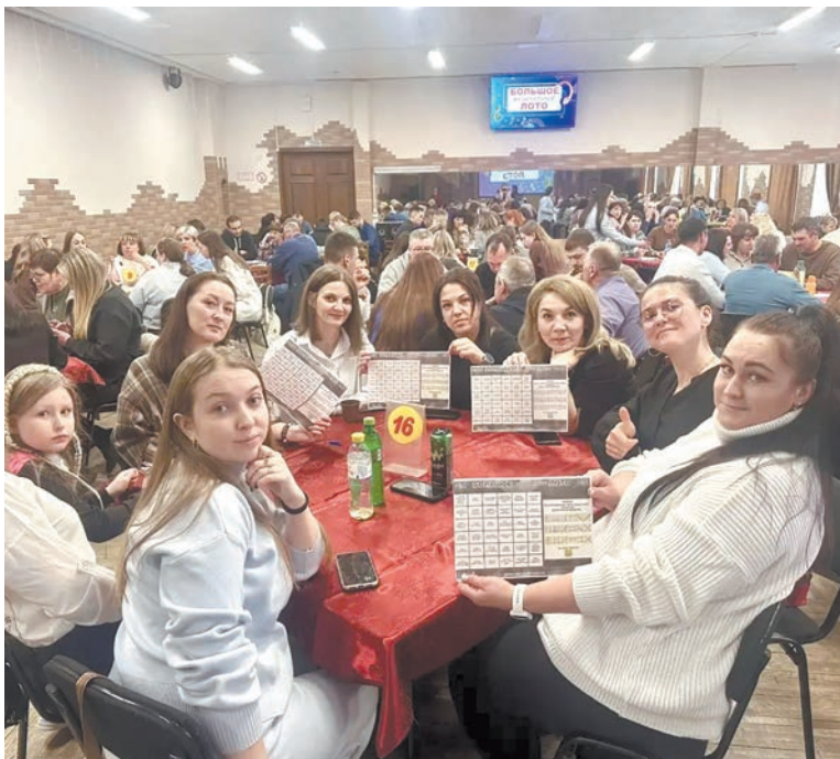
Северобайкальский филиал Дорпрофжел на ВСЖД провел первую игру «Музлото» для работников первичек