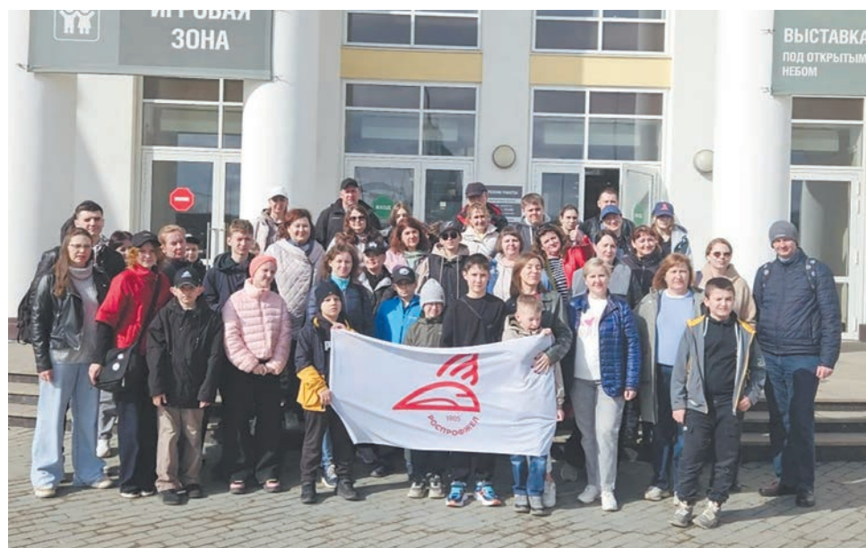
Дорпрофжел на ЮУЖД организовал для работников и их детей поездку в один из крупнейших в России частных музеев — комплекс гражданской и военной техники в Верхней Пышме