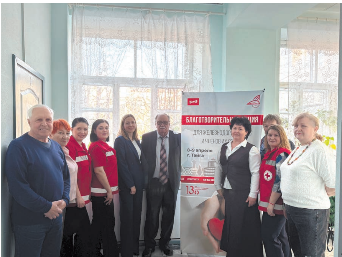
Руководство Западно-Сибирской дороги, Дорпрофжел на ЗСЖД совместно с организацией Красный Крест провели благотворительную акцию, направленную на оказание медико-социальной поддержки нуждающимся работникам и ветеранам-железнодорожникам, проживающим на станции Тайга