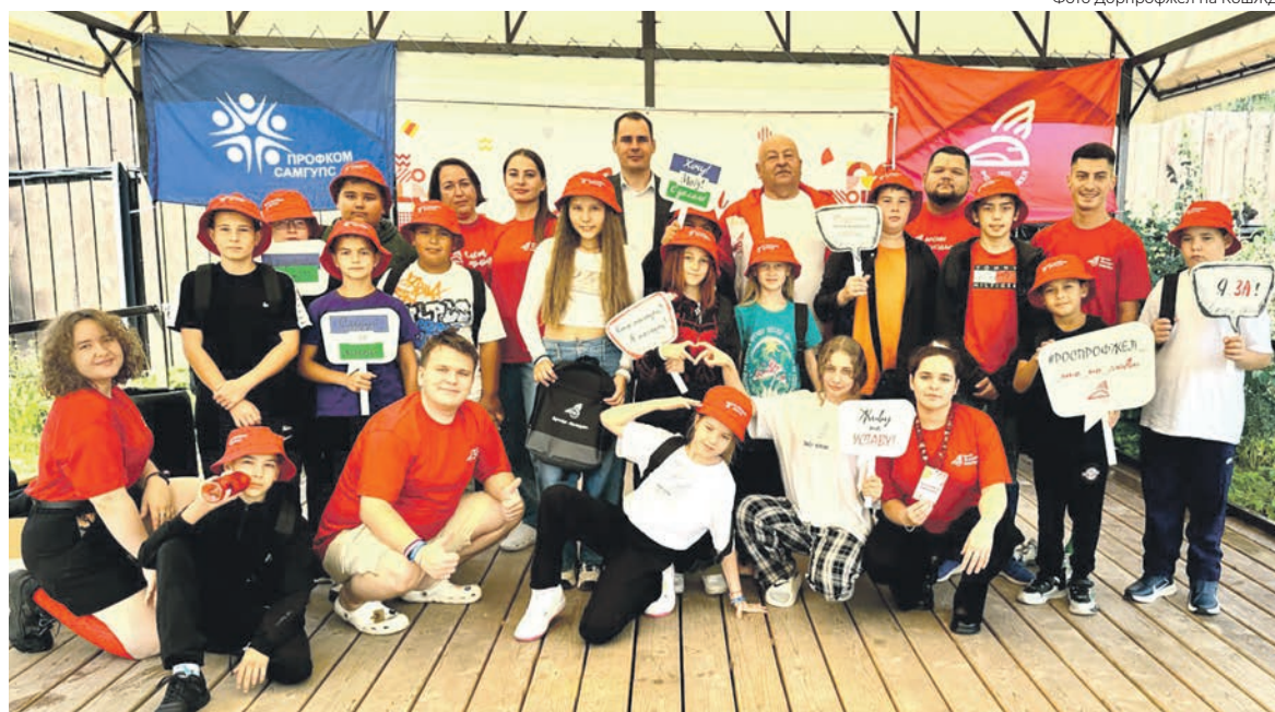
Дети железнодорожников из Башкортостана из многодетных семей и тех, чьи родители находятся на специальной военной операции, познакомились с профсоюзом на базе отдыха

“ Модуль «Время молодых. Детство» был реализован 119 профсоюзными активистами студенческих первичек.