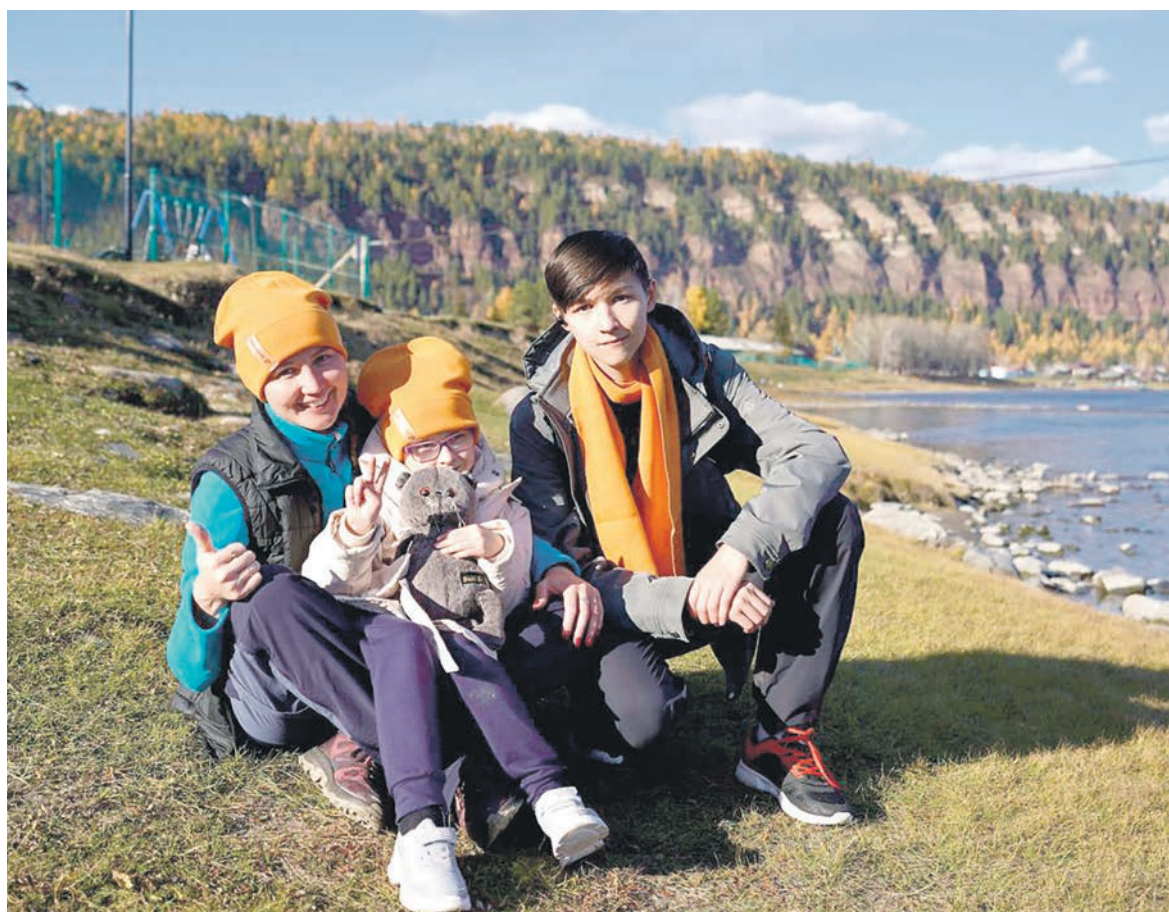
В Иркутске прошел семейный фестиваль Дорпрофжел на ВСЖД