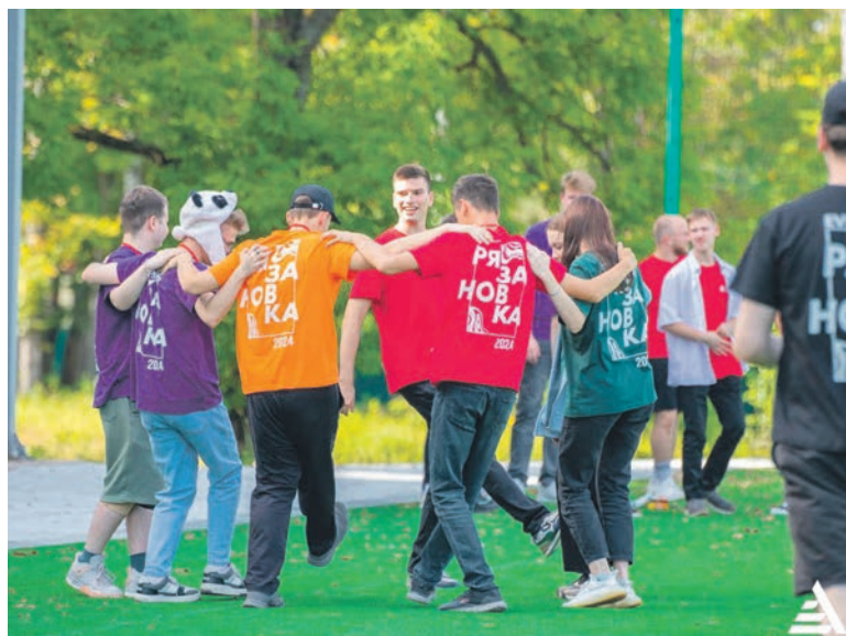
Активисты студенческой первички Дальневосточного ГУПС стали участниками креативно-молодежного лагеря «Рязановка-2024»