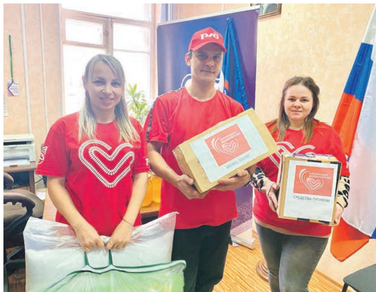
Волонтеры — работники железнодорожного узла Бабаево ОЖД поддержали бойцов, находящихся в зоне специальной военной операции