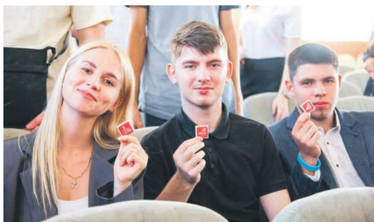
В Ростовском ГУПС профком студентов организовал мероприятие «РГУПС внеучебный»