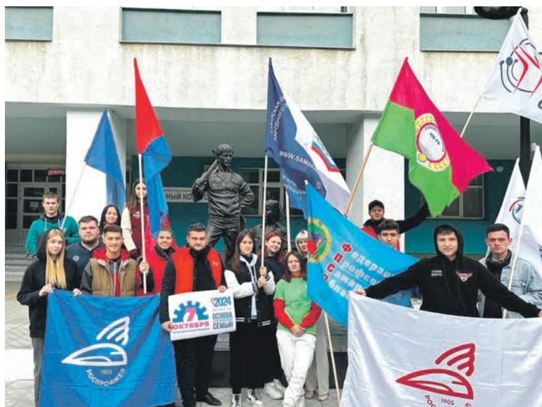
В преддверии Всемирного дня действий «За достойный труд» активисты ППО студентов Приволжского ГУПС провели автопробег