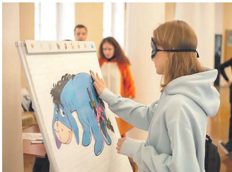
Активисты волонтерского центра Петербургского ГУПС провели день защиты животных