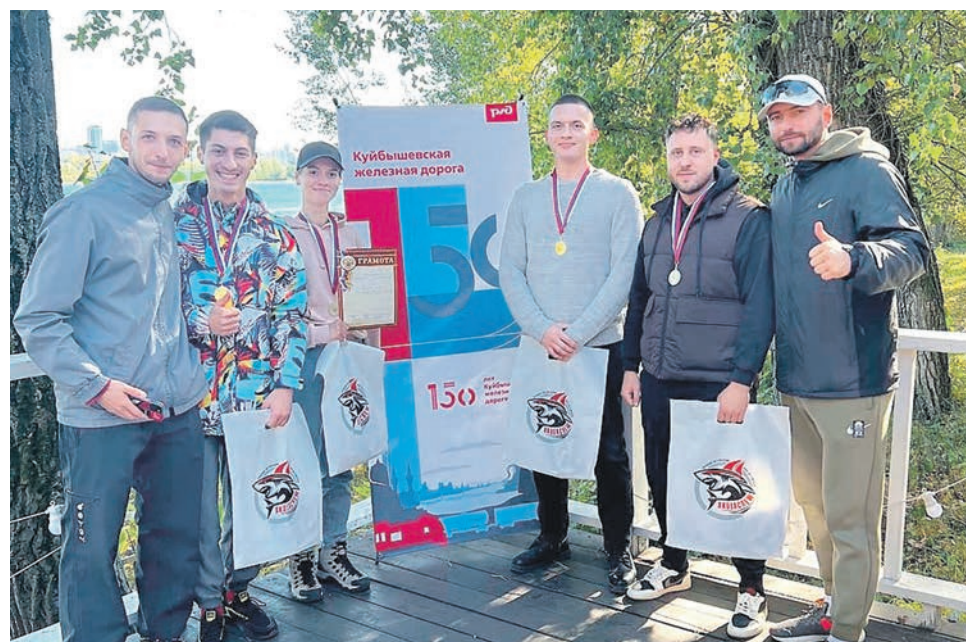
Команда Молодежного совета Дорпрофжел на КбЖД стала участником первой парусной регаты Куйбышевской железной дороги, посвященной 150-летию магистрали