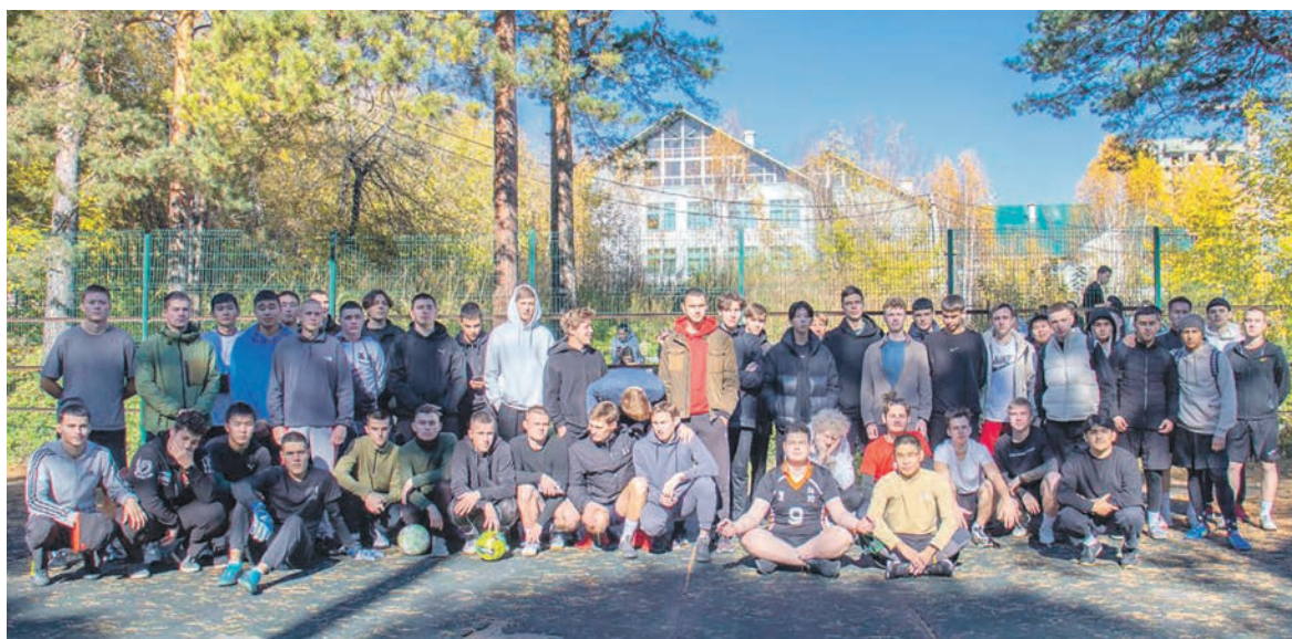
В Иркутском ГУПС прошел турнир по фиджитал-футболу