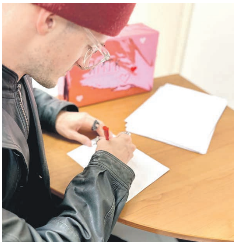
Первичка РУТ (МИИТ) провела акцию, в рамках которой каждый смог поделиться своими мыслями и переживаниями