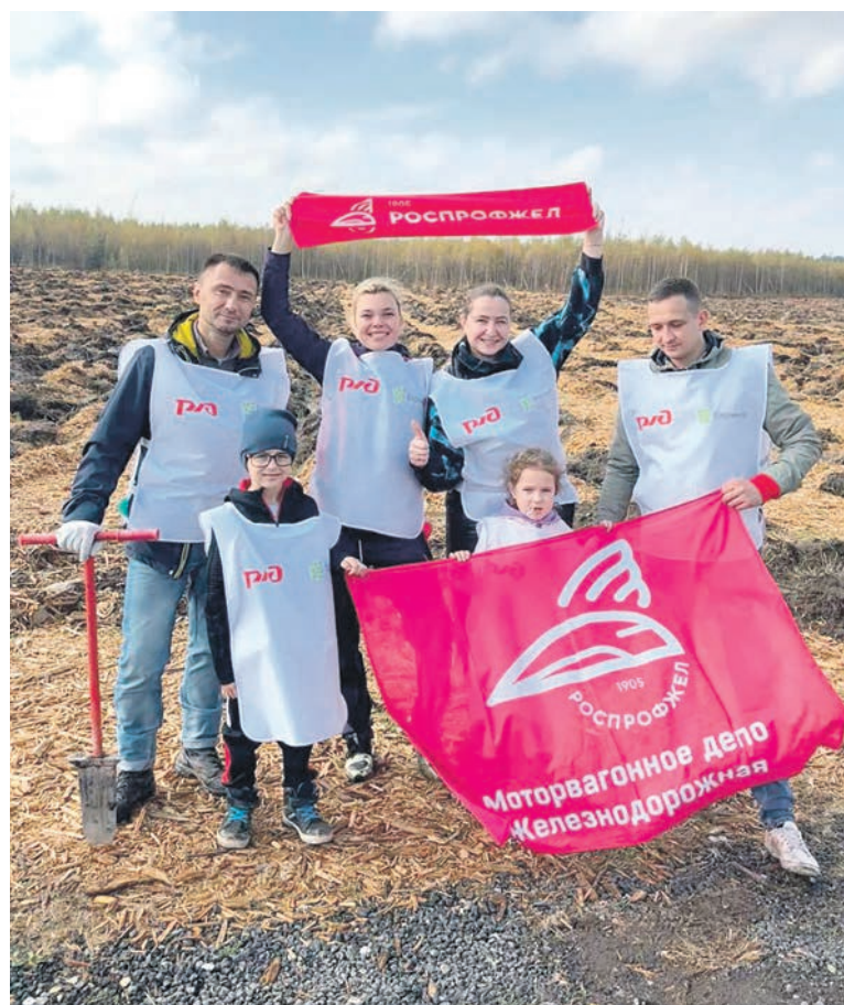
Работники моторвагонного депо Железнодорожная МЖД со своими семьями поучаствовали в акции «Сохраним лес»