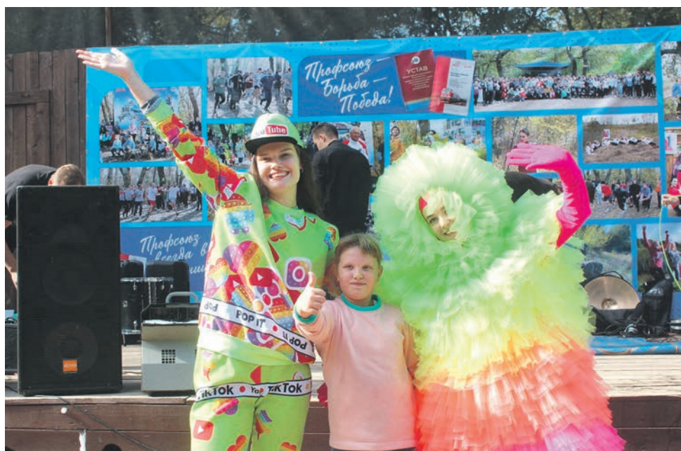
Свыше 500 членов профсоюза Волгоградского Теркома РОСПРОФЖЕЛ и их семьи стали участниками спортивного праздника «Волгоградский азимут»