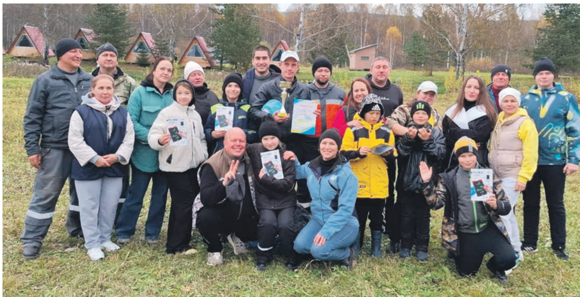
Работники Красноуфимского железнодорожного узла ГЖД вместе с родными и близкими получили позитивные эмоции на туристическом слете