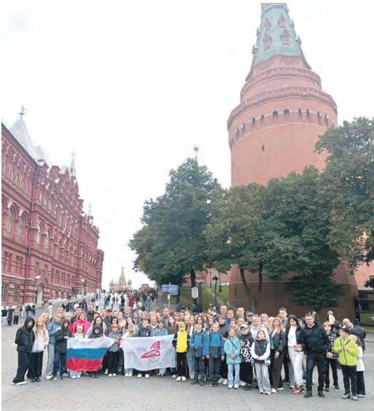
Члены первички Лискинского железнодорожного узла на ЮВЖД побывали с экскурсией в Москве