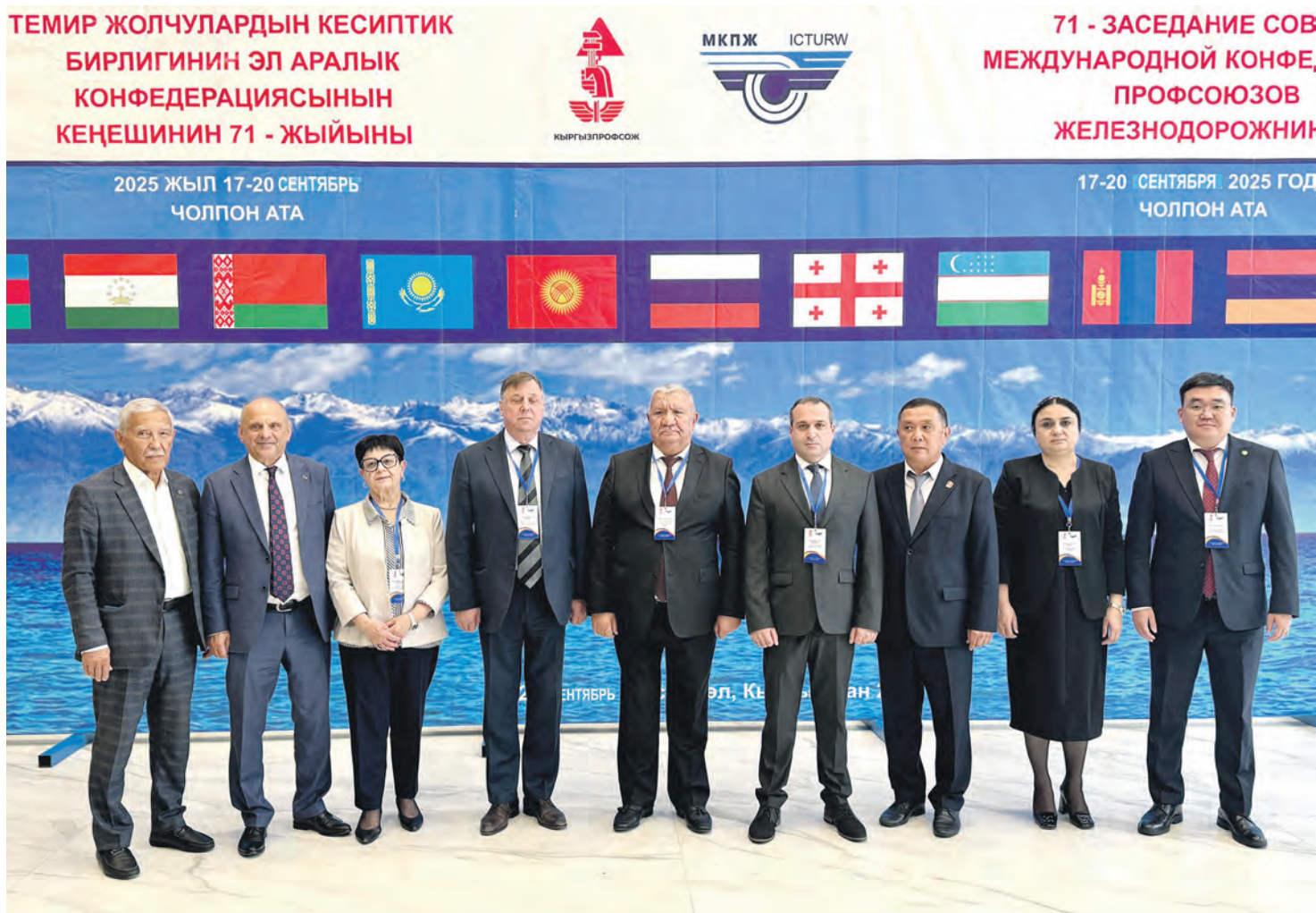
Главы профсоюзов, входящих в МКПЖ, обменялись опытом социальной защиты работников