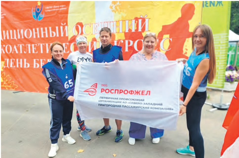
Команда АО «СЗ ППК» Октябрьской магистрали стала победителем легкоатлетического кросса от Адмиралтейского района «День бега»