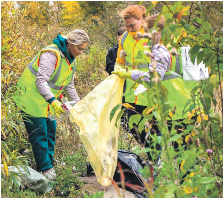
Профсоюзные и молодежные активисты, волонтеры Путьевой машинной станции № 194 Северной магистрали приняли участие в городском экологическом субботнике «Чистые игры»