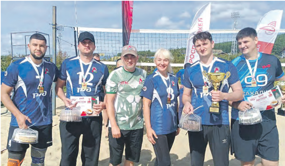
В Южно-Сахалинске прошел турнир по пляжному волейболу среди членов РОСПРОФЖЕЛ Сахалинского территориального управления ДВЖД