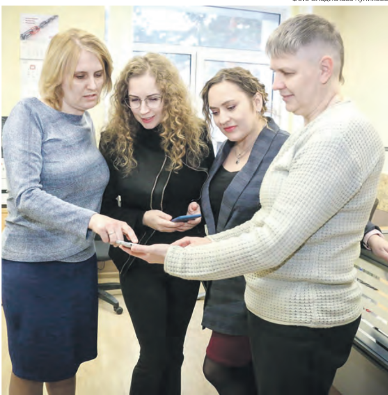
В акции может участвовать любой член профсоюза полигона Свердловской дороги, зарегистрировавшийся в личном кабинете