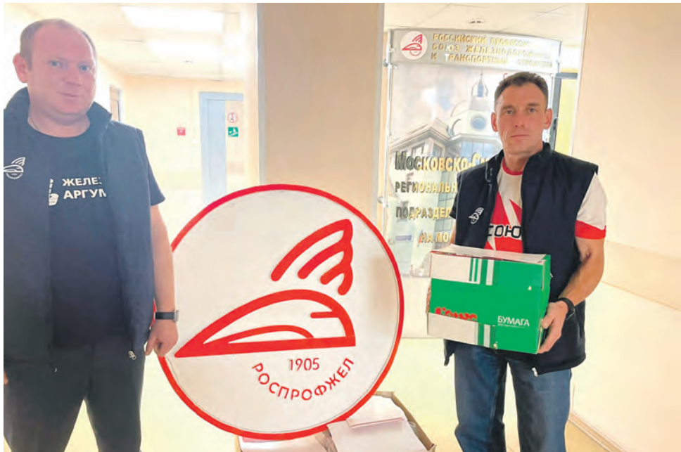
Активисты Московско-Смоленского РОП Дорпрофжел на МЖД сдали 300 кг макулатуры на специализированное предприятие для дальнейшей переработки