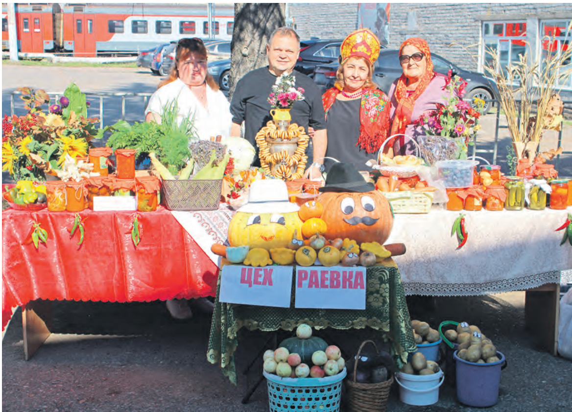
Благотворительная ярмарка «Осенний урожай» прошла на территории эксплуатационного локомотивного депо Уфа Куйбышевской железной дороги