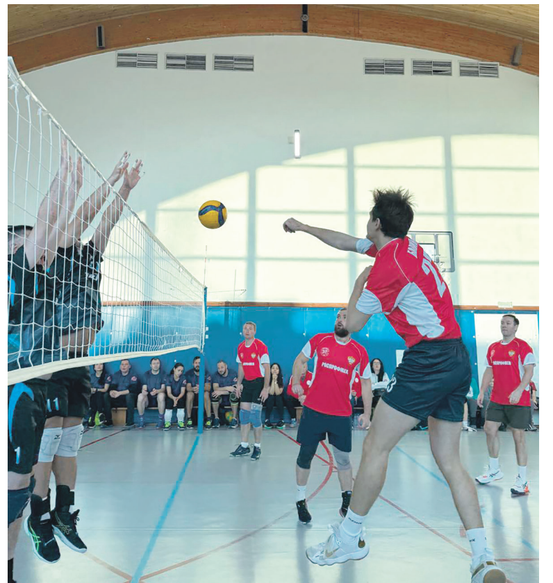
В Москве прошел турнир по волейболу на Кубок председателя Терпрофжел МОСЖЕЛТРАНС, золото — у спортсменов первичной профсоюзной организации сотрудников МИИТ