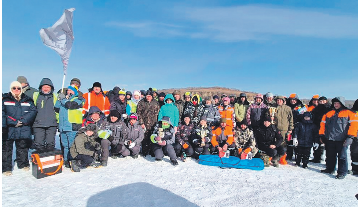
16 команд железнодорожников проверили рыбацкую удачу на соревнованиях по подледному лову, организованных Владивостокским филиалом Дорпрофжел на ДВЖД