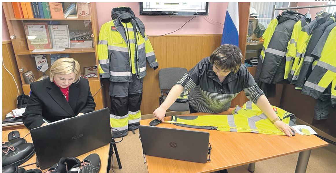
Новая сигнальная летняя куртка успешно прошла проверку

Что проверяют? Полное соответствие заявке (модель, размер,