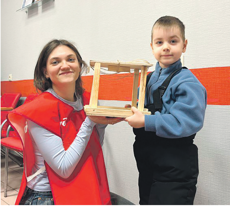
Молодежь Брянского отделения Дорпрофжел на МЖД и студенты Брянского регионального железнодорожного техникума провели акцию «Покормите птиц зимой»