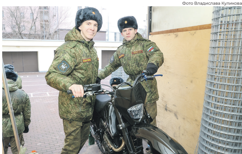
Очередную партию гуманитарки доставлена железнодорожным войскам в декабре

«Благодаря участию профактива было собрано 6 тонн продовольствия. В том числе быстро разогреваемая еда длительного