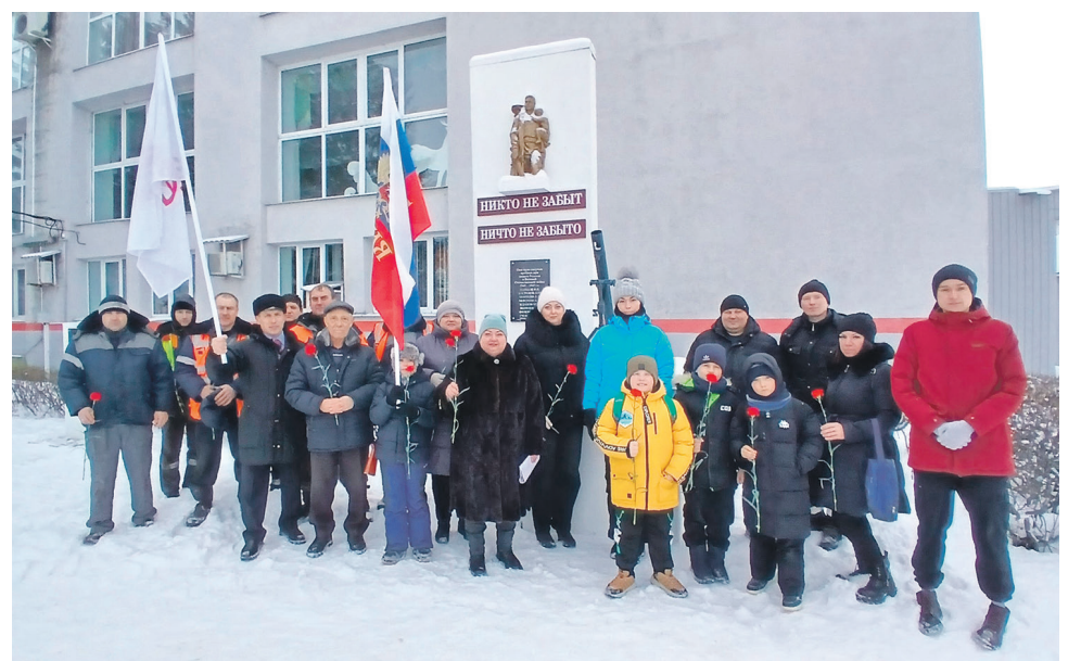
25 января, в день 83-й годовщины освобождения Воронежа от немецко-фашистских захватчиков, на Аллее Славы моторвагонного депо Отрожка ЮВЖД прошла церемония возложения цветов