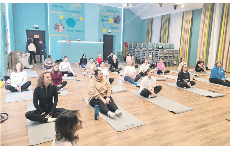
В Центре молодежи и юношества им. К.С. Заслонова ЗСЖД прошла профсоюзная суббота — «девчонки», созданный специально для женщин