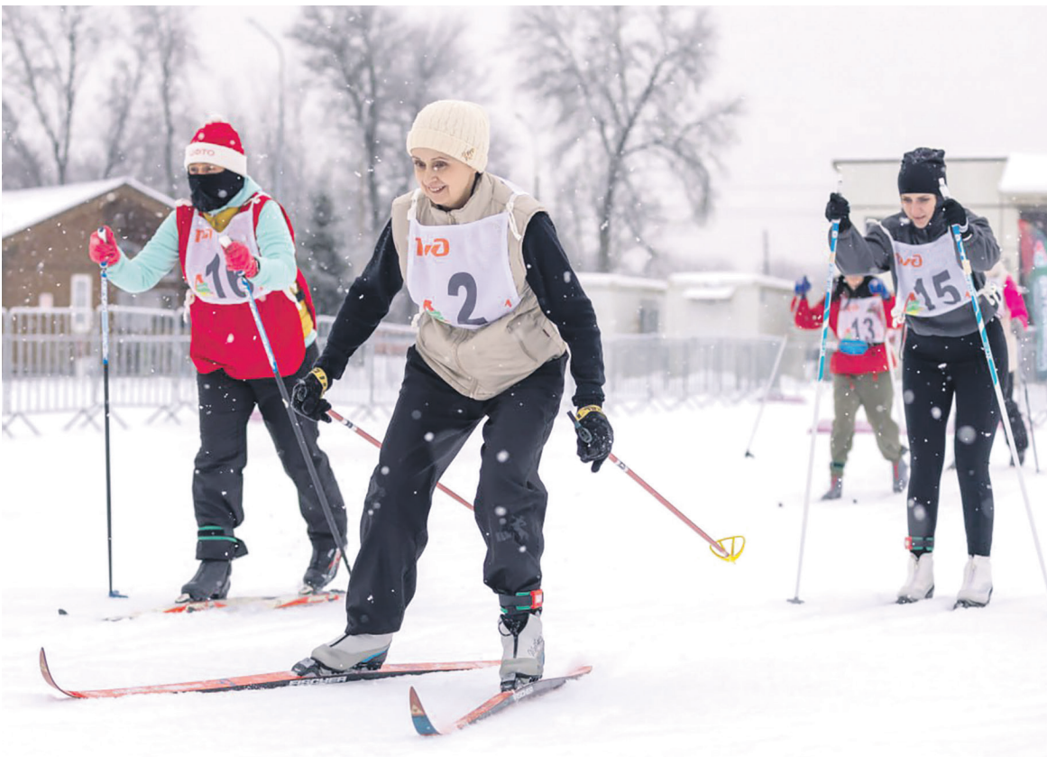
Дорпрофжел на ОЖД открыл спортивно-массовый сезон этого года «Рождественской лыжней», на старт вышли почти 200 членов профсоюза