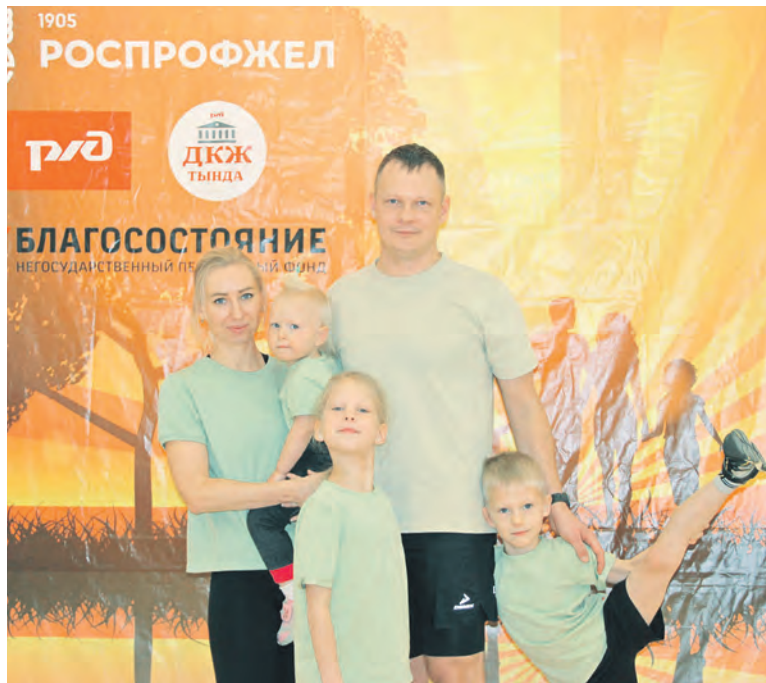
Тындинский филиал Дорпрофжел на ДВЖД собрал семьи железнодорожников для участия в спортивно-развлекательной игре «Семья года»