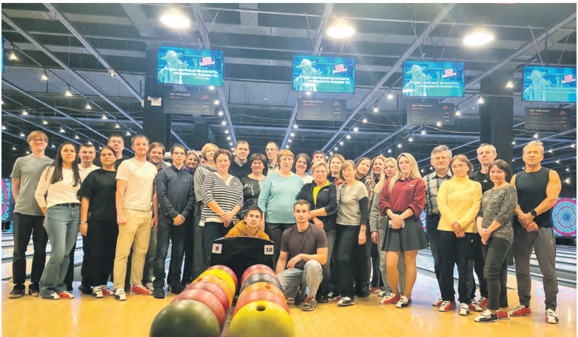
Осенний поход в боулинг организовал профком Самарского информационно-вычислительного центра Куйбышевской магистрали