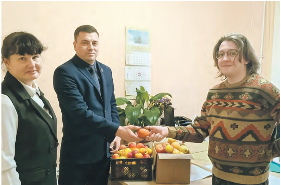
Профком и отдел кадров моторвагонного депо Казань Горьковской магистрали позаботились о витаминизации работников