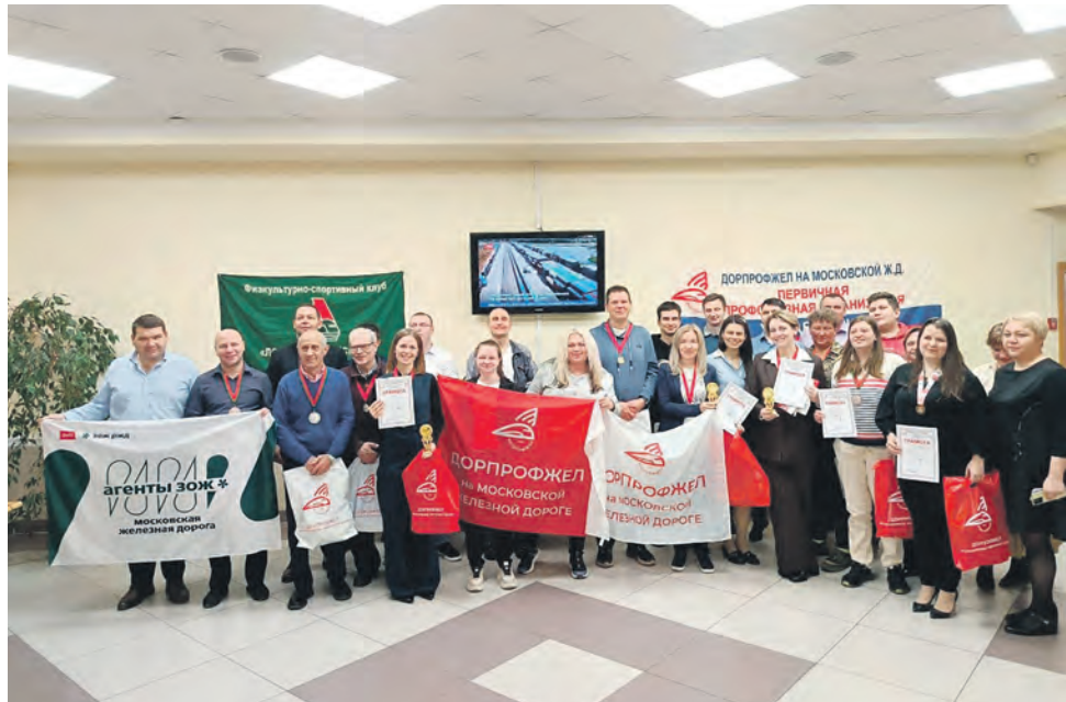
Турнир по шашкам, организованный профкомом управления Московской железной дороги, собрал более 50 членов профсоюза