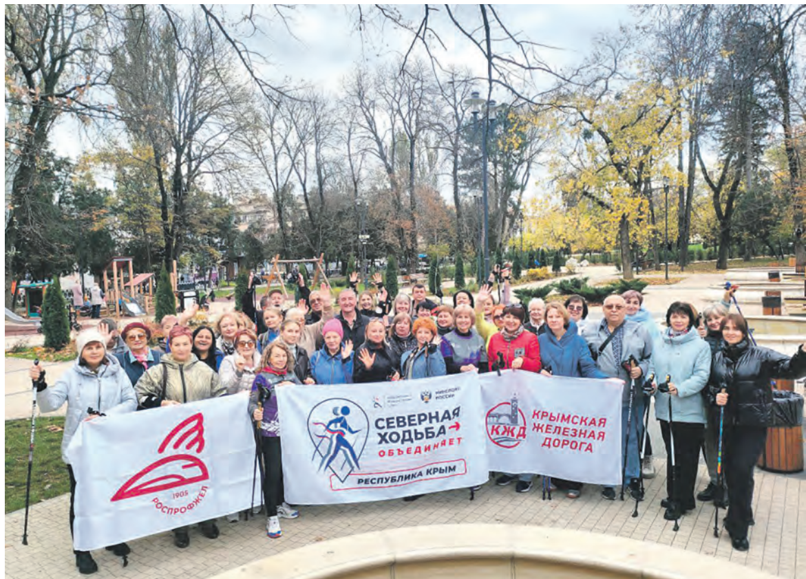
Более 40 представителей Дорпрофжел на Крымской железной дороге приняли участие во Всероссийском физкультурно-оздоровительном проекте «Северная ходьба объединяет»