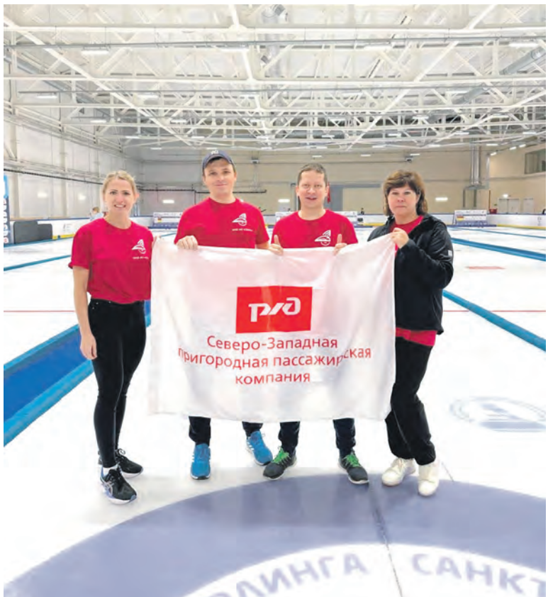
Члены профсоюза — работники АО «Северо-Западная пригородная пассажирская компания» — приняли участие в соревнованиях городской лиги по керлингу среди трудовых коллективов Санкт-Петербурга