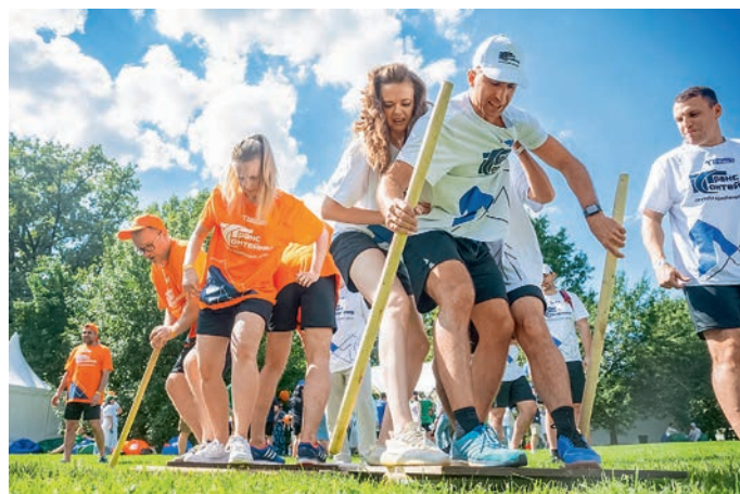
Спартакиада «ТрансКонтейнера», приуроченная ко Дню железнодорожника