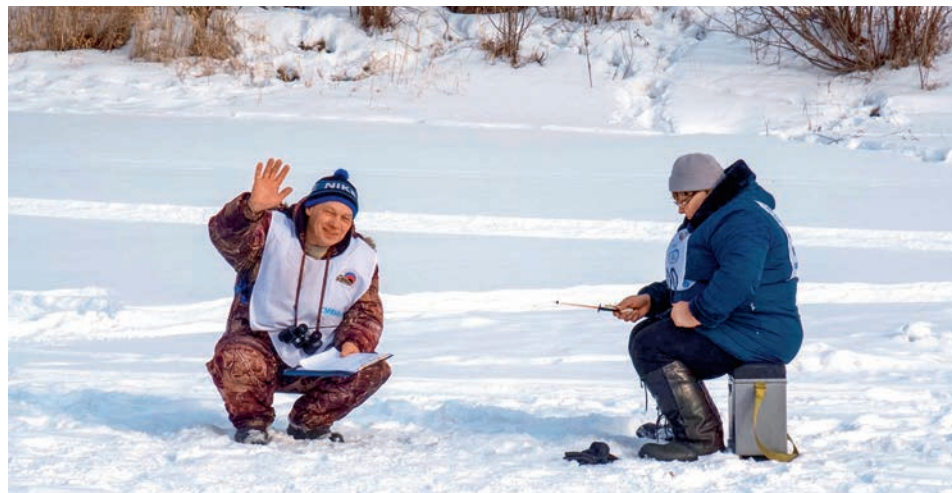
Чемпионат работников Иланского узла по подледному лову. Дорпрофжел на Красноярской железной дороге