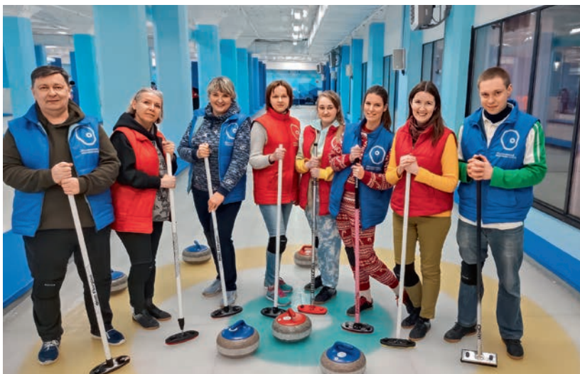
Турнир по керлингу. ППО ПАО «ТрансКонтейнер»