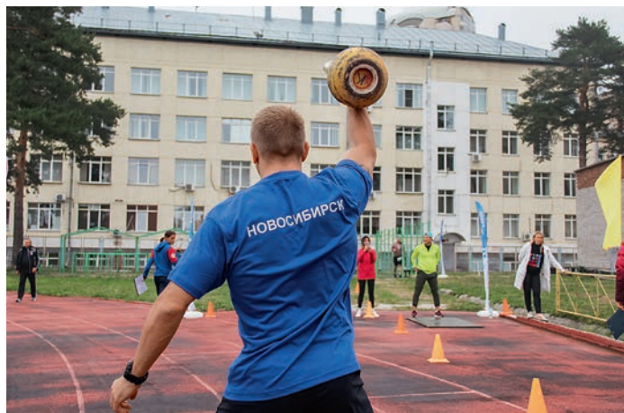
«Мы вместе». Дорожный этап. Дорпрофжел на Западно-Сибирской железной дороге