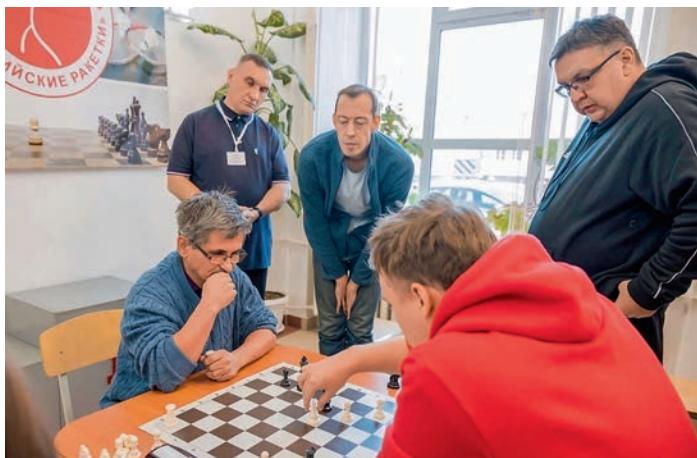
Пермь. Спартакиада. Дорпрофжел на Свердловской железной дороге