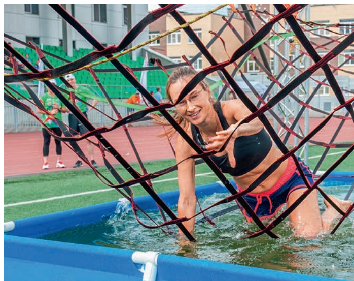
«Мы вместе». Дорожный этап. Дортрофжел на Южно-Уральской железной дороге