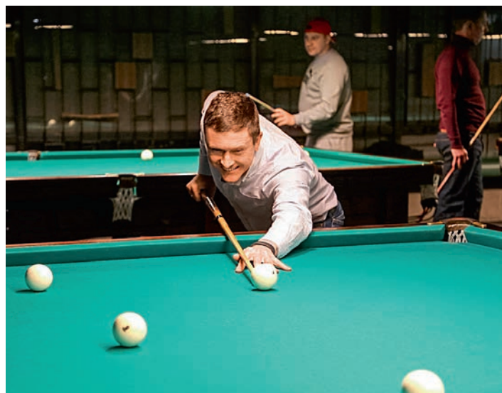
В Кубок Дорпрофжел на Куйбышевской железной дороге по русскому бильярду