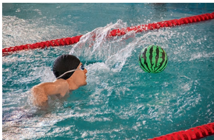
Соревнования по плаванию на кубок председателя Дорпрофжел на Забайкальской железной дороге