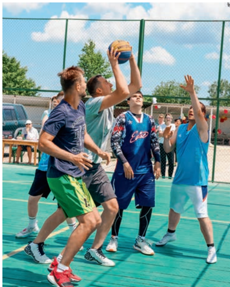
Турнир по баскетболу на Кубок председателя Дортпрофжел на Дальневосточной железной дороге