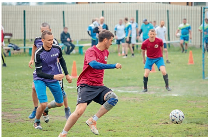
«Мы вместе». Дорпрофжел на Восточно-Сибирской железной дороге