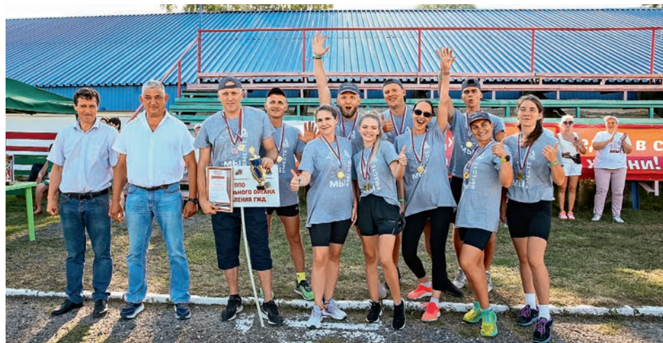
«Мы вместе». Дортрофжел на Горьковской железной дороге