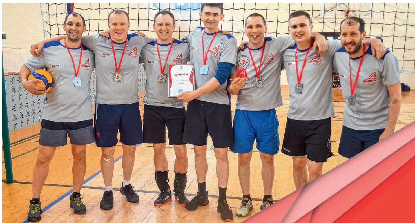
Первенство Вологодского железнодорожного узла по волейболу. Дортпрофжел на Северной железной дороге