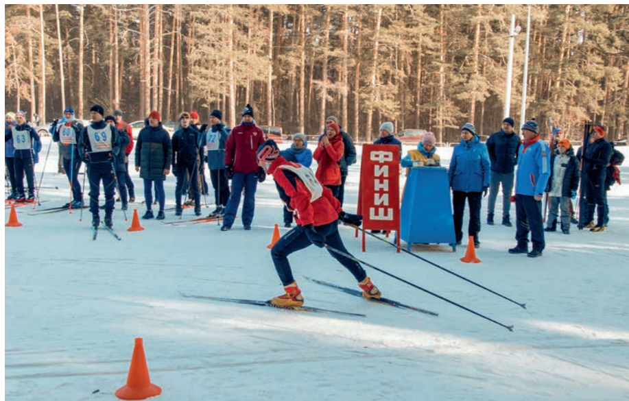
Лыжные гонки. Дортпрофжел на Южно-Уральской железной дороге