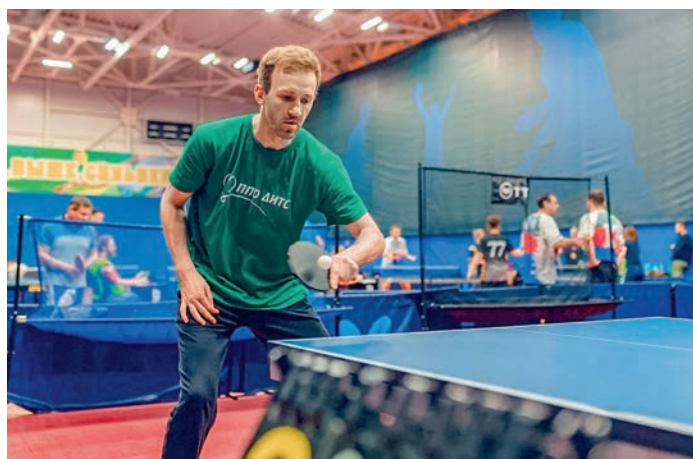
Спартакиада Московского метрополитена. Теннис