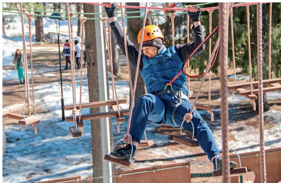
Зимний туристический слет. Дорпрофжел на Октябрьской железной дороге