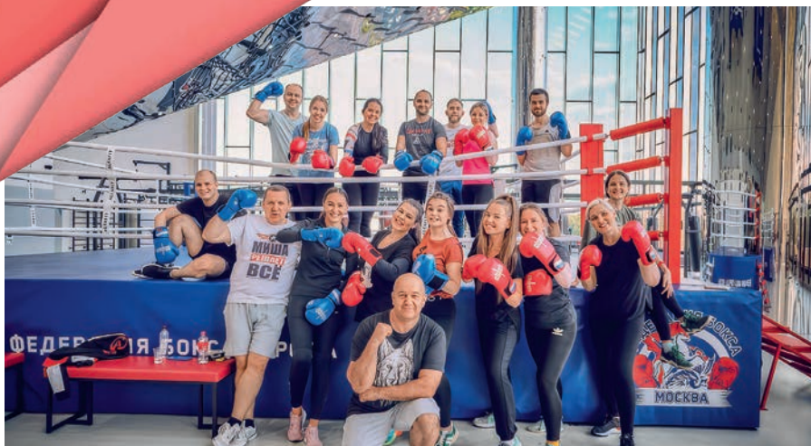
Для работников АО «ФГК» были организованы дни открытых дверей в спортивных центрах