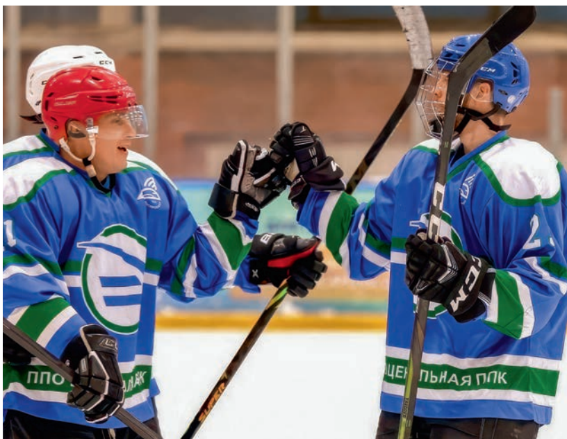
Хоккейная команда АО «ЦППК» – участник регулярного чемпионата Ночной хоккейной лиги