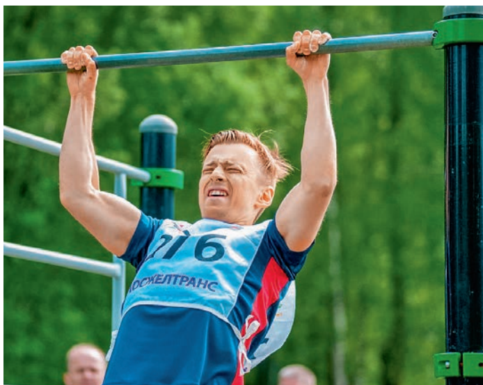
Спартакиада Терпрофжел МОСЖЕЛТРАНС