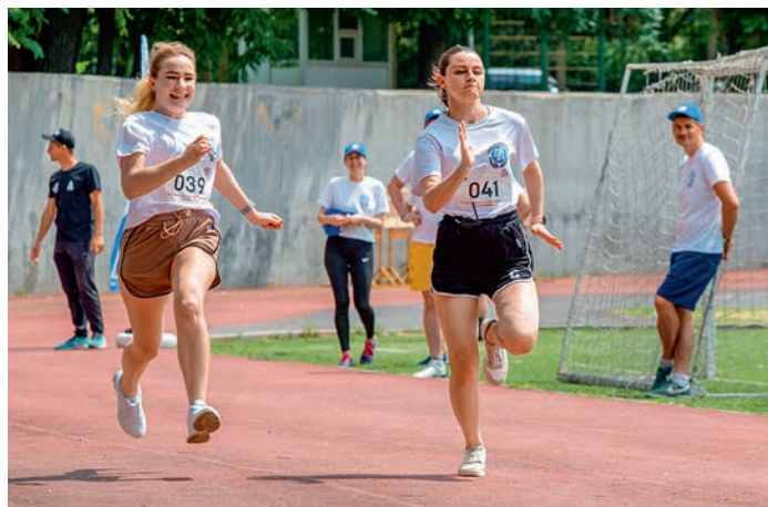
«Мы вместе». Дорпрофжел на Северо-Кавказской железной дороге