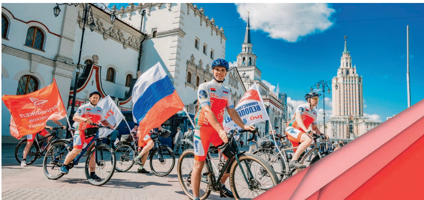
Велопробег, посвященный 78-й годовщине Победы в Великой Отечественной войне. Дорпрофжел на Московской железной дороге