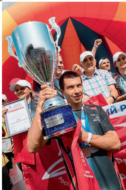
«Мы вместе». Дорожный этап. Дортрофжел на Московской железной дороге