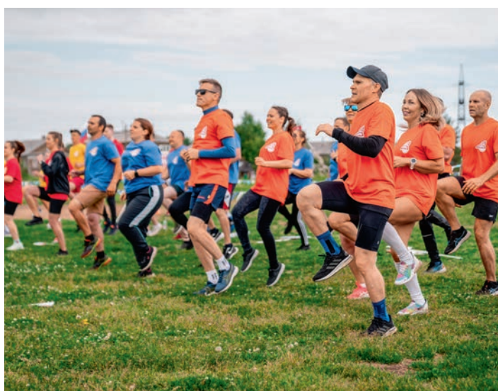
«Мы вместе». Региональный этап, Архангельский регион. Дортрофжел на Северной железной дороге