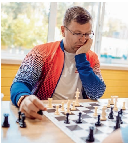
Спартакиада метрополитенов России. Шахматы

Профсоюзные организации уделили внимание не только массовому спорту, но и небольшим группам членов профсоюза, увлеченным редкими видами спорта, например сап-серфингом. В состязаниях по отдельным видам спорта, днях здоровья, спартакиадах, турнирах, велопробегах, марафонах, лыжных гонках принимали участие и близкие члены РОСПРОФЖЕЛ. Все чаще в программу мероприятий организаторы включали фиджитал-спорт.