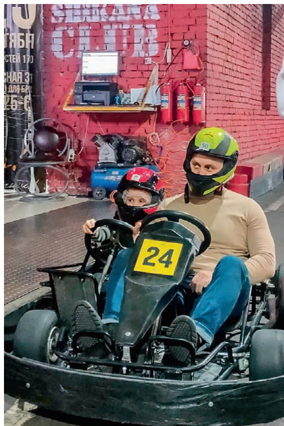
Первенство по картингу ППО сервисного локомотивного депо Пенза ООО «СТМ-Сервис»