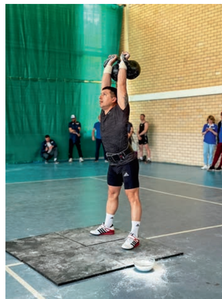
Летняя спартакиада на кубок АО «Дороги и мосты»