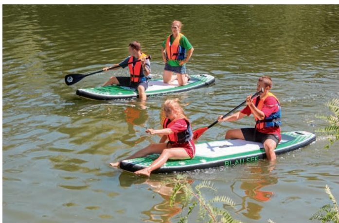
Молодежный профсоюзный форум «Сила движения» Волгоградского Теркома