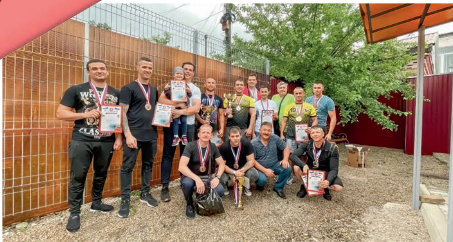
Чемпионат по гиревому спорту. Дортрофжел на Крымской железной дороге