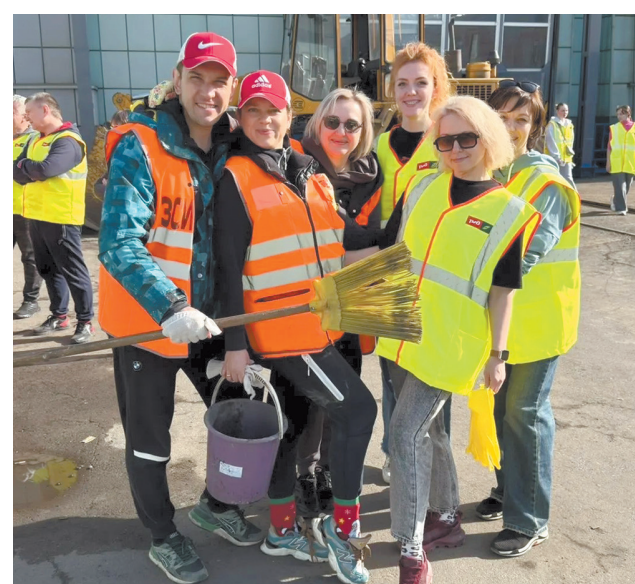
Западно-Сибирская железная дорога