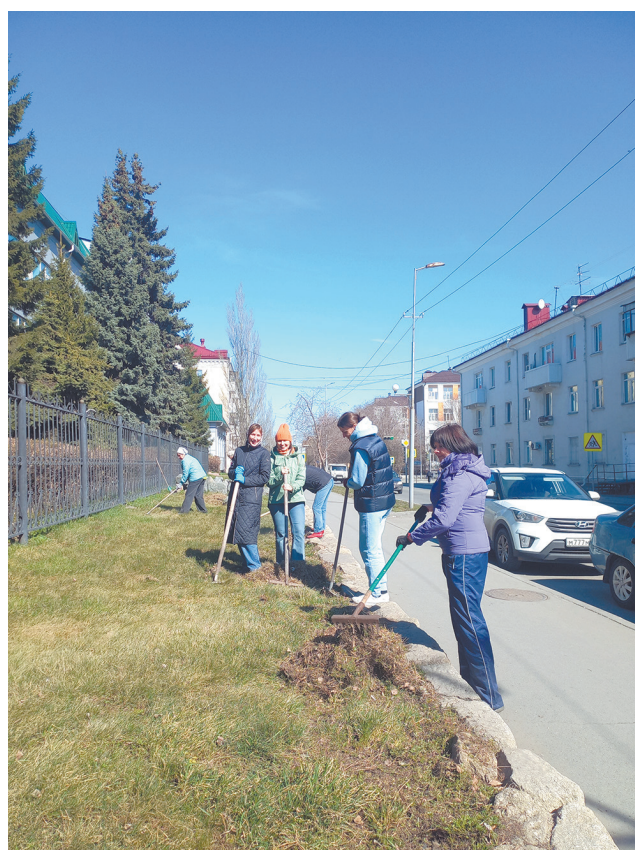
Южно-Уральская железная дорога