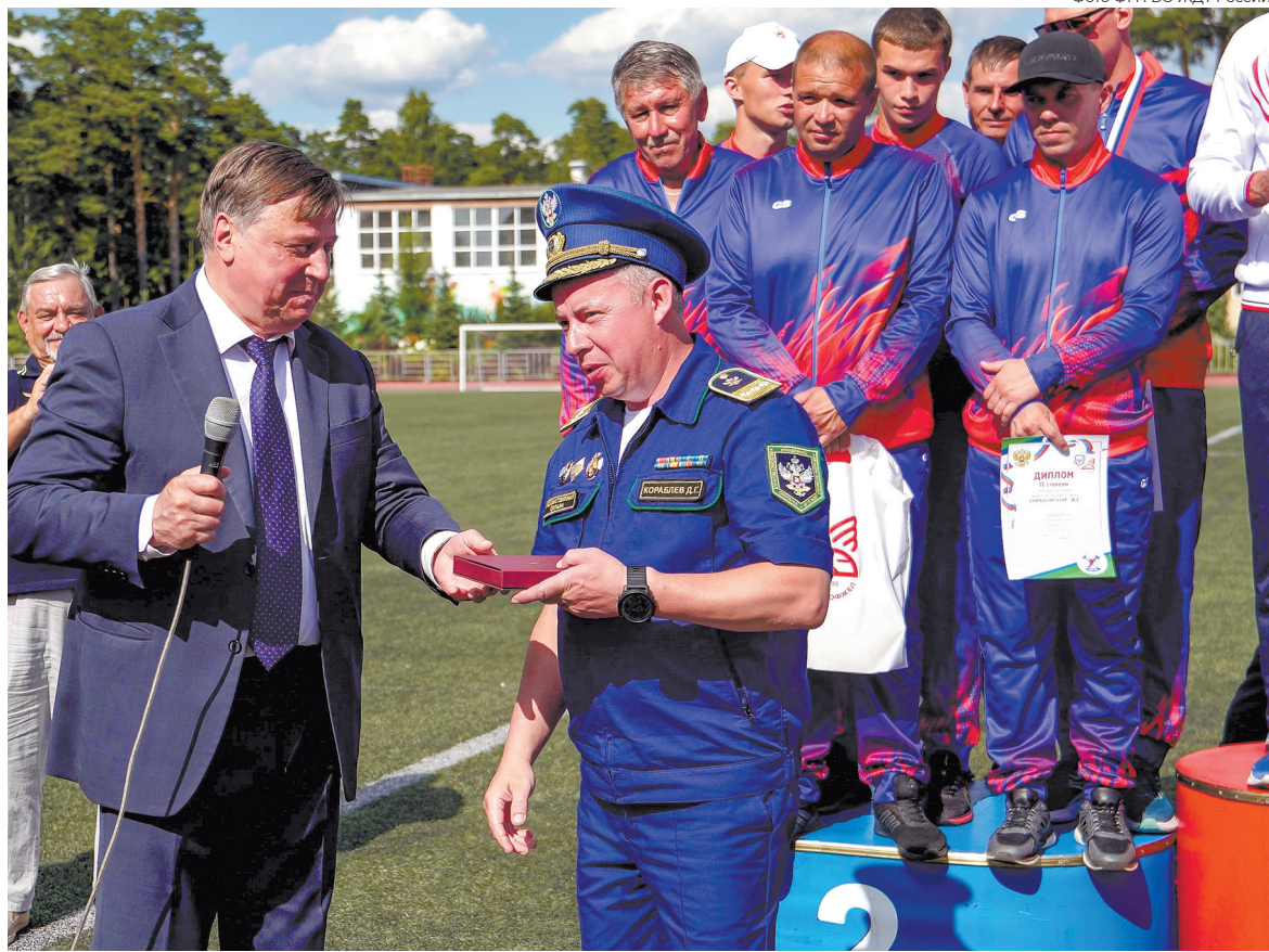
Десятый чемпионат по пожарно-спасательному спорту был организован на базе филиала предприятия на Горьковской железной дороге при поддержке РОСПРОФЖЕЛ

к профессиональным аварийно-спасательным формированиям.