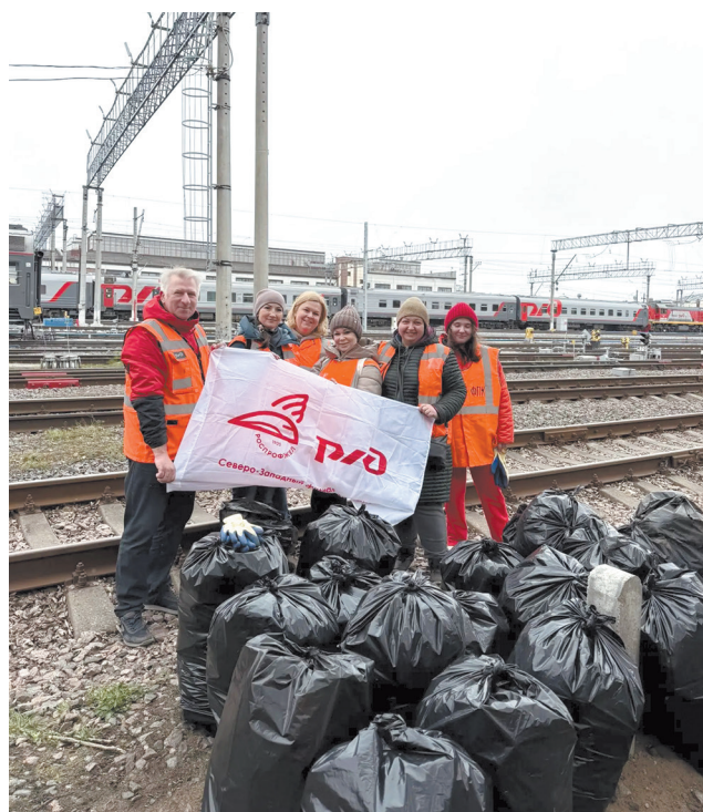
Октябрьская железная дорога