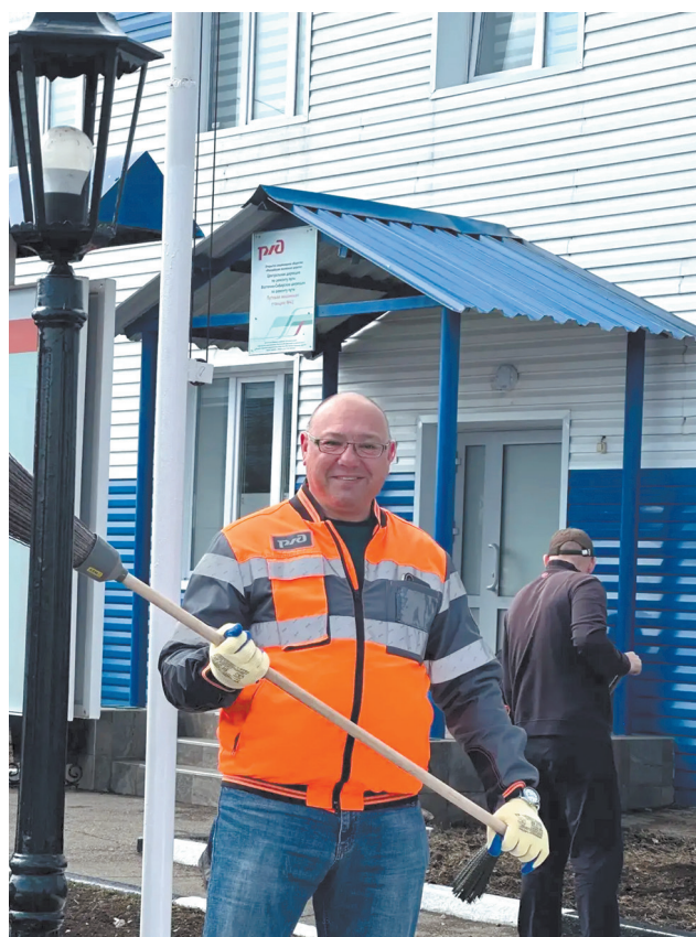
Восточно-Сибирская железная дорога