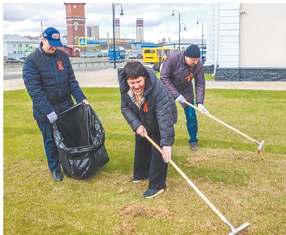
Северная железная дорога