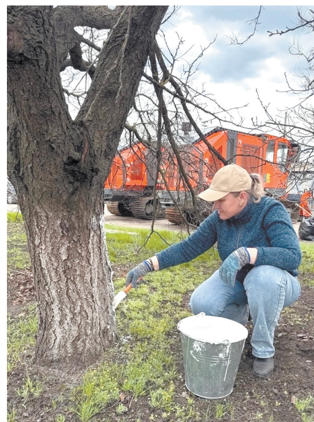
Юго-Восточная железная дорога