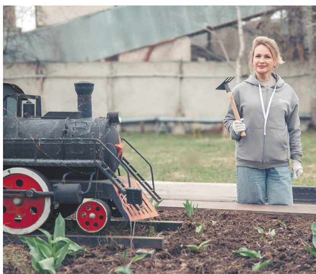
Горьковская железная дорога