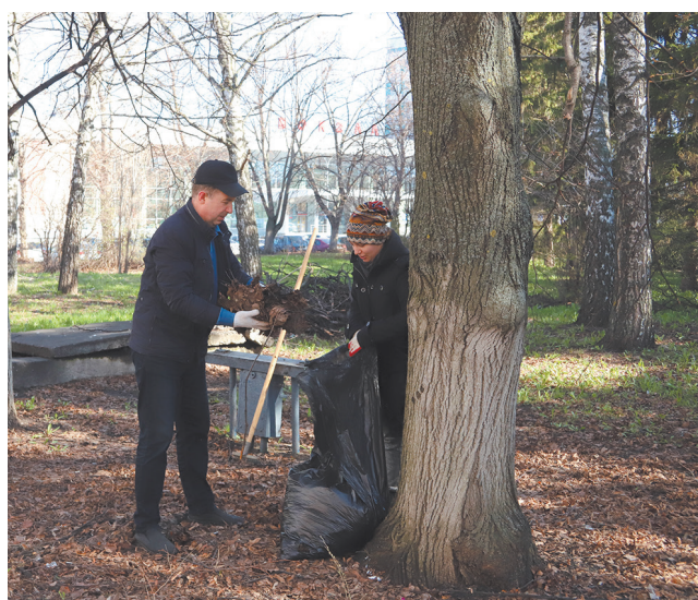
Куйбышевская железная дорога

Апрельская уборка — традиция, которая уже более века объединяет стальные магистрали страны. В этом году по инициативе коллективов и ветеранов депо Москва-Сортировочная железнодорожники посвятили свой труд 81-й годовщине Великой Победы. О том, как сеть поддержала столичный почин, — в нашем сегодняшнем фоторепортаже.