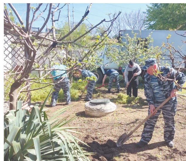
Крымская железная дорога