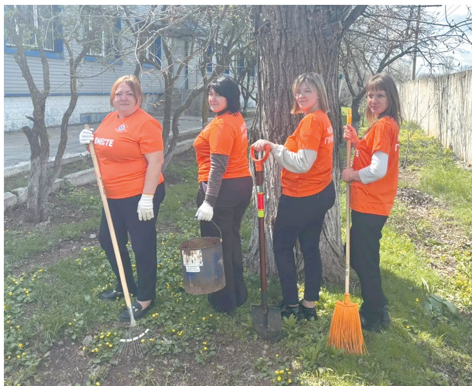
Приволжская железная дорога