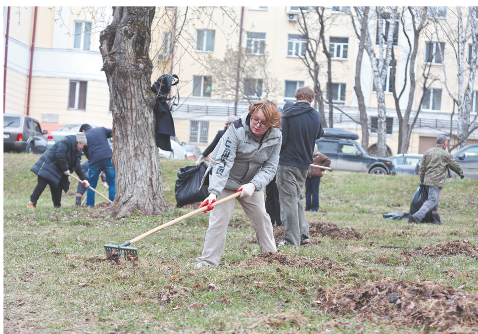
Свердловская железная дорога