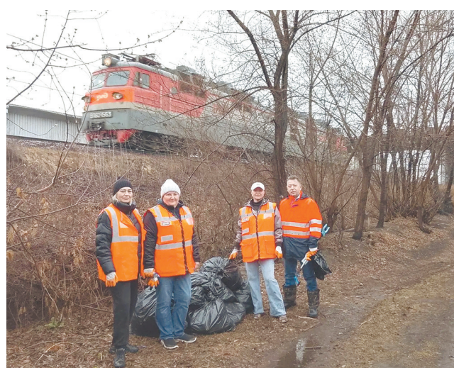
Красноярская железная дорога