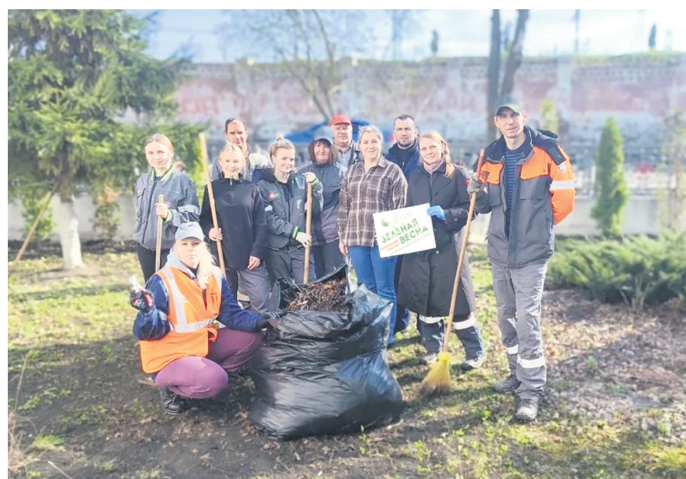
Московская железная дорога