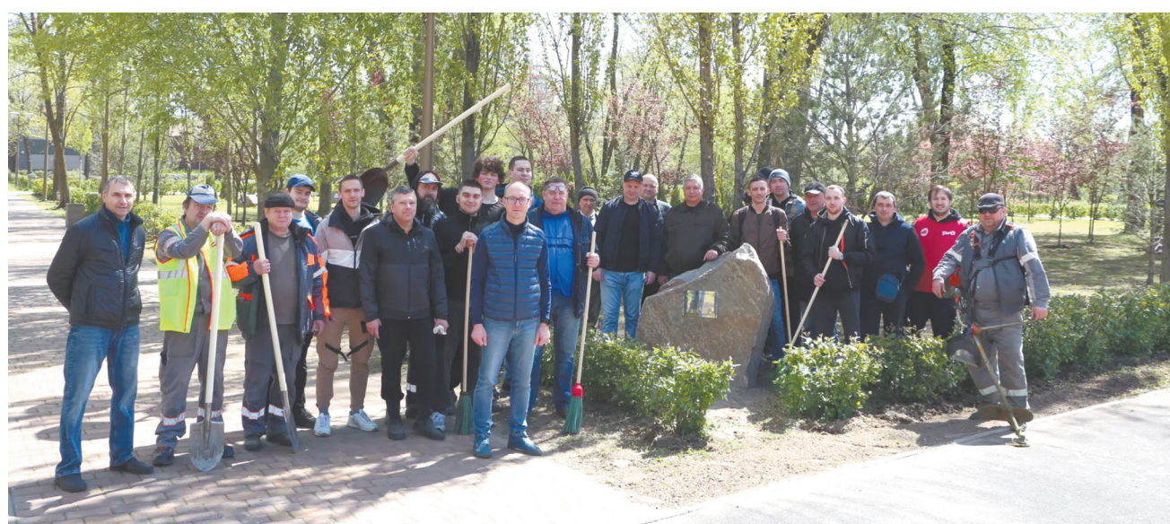
Северо-Кавказская железная дорога