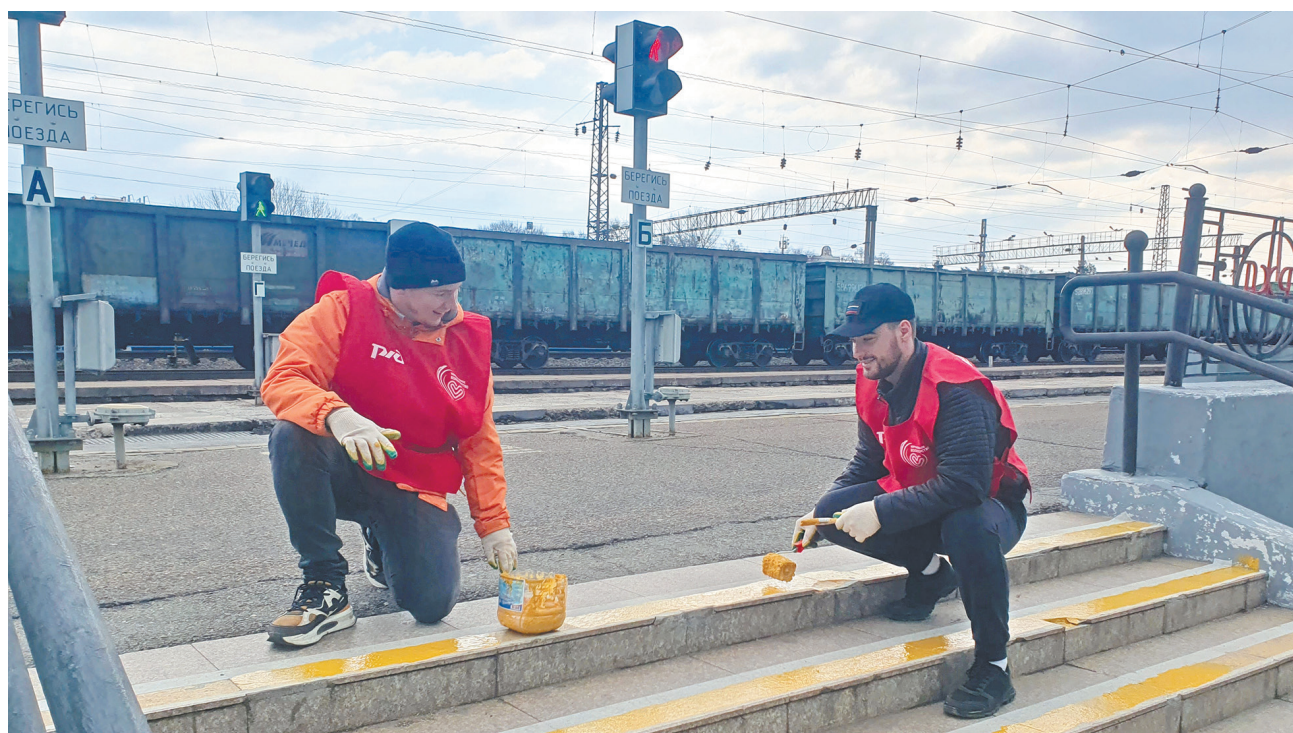
Дальневосточная железная дорога