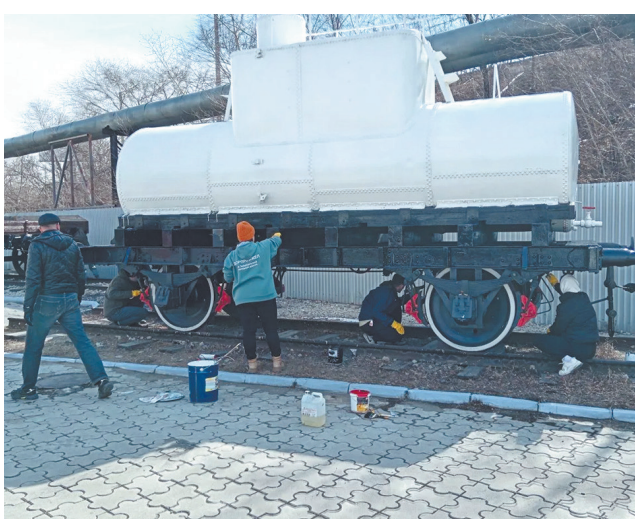
Забайкальская железная дорога